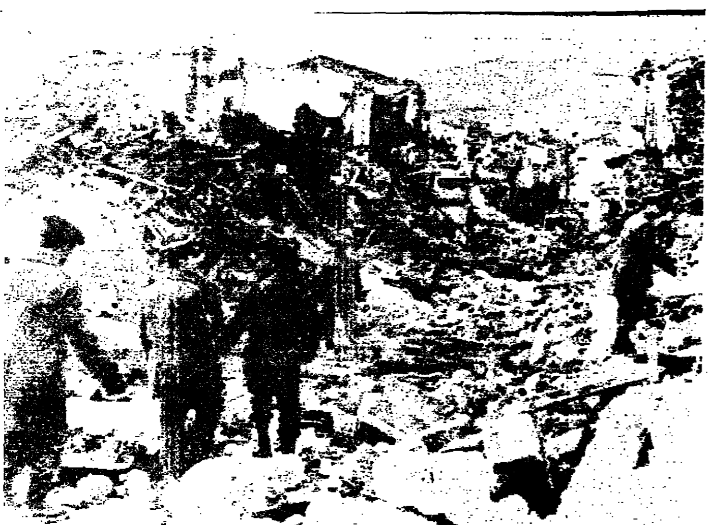
رجال الشرطة يحيطون بين الانفصاليين ويصوتون ببقائه الى اي صوت يبعث منها ويمكن ان يدل على وجود احصائيد الزلزال المدرة التي قربت قرية مونتيفانو في جزيرة صقلية ( تصوير المونتيفانوس )